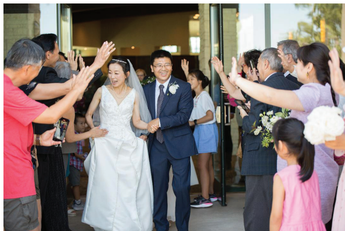
賓客們夾道歡送新婚夫婦離開宴會廳