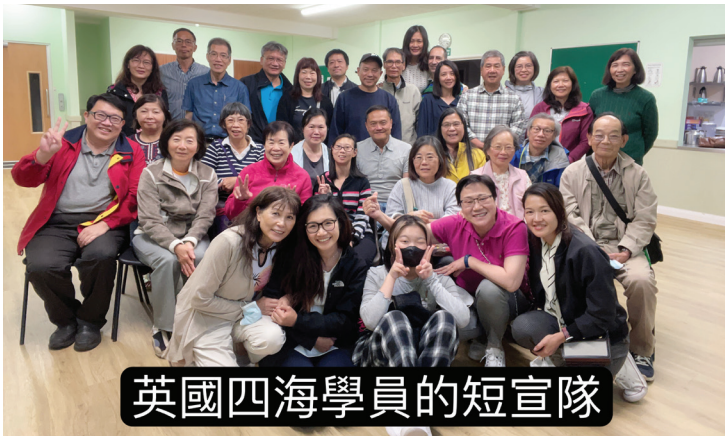
英國四海學員的短宣隊

我們還去參與服事流浪漢，我們在凌晨三點左右開車到不同的地點去取麵包，然後將麵包載去服事中心，把甜的、鹹的和純麵包分類。到了早上八點，難民們就來到中心領取合他們胃口的麵包，每個難民都會按著他們家庭人數拿取一天的糧食份額。