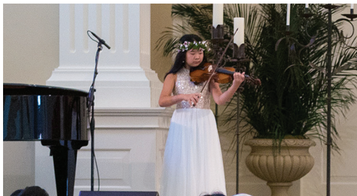
喻牧師女兒在婚禮中拉小提琴