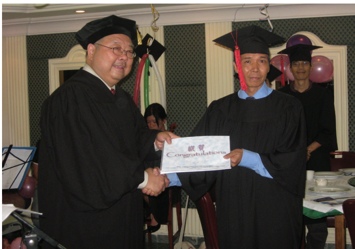
2009年獲頒傳道證書，攝於委內瑞拉

他1987年結婚，育有一女。1991年林太太決志信主耶穌。林興群仍嗜賭，常徹夜不歸，令夫妻關係亮起了紅燈。有一次林太太發現他向銀行以高利息借款，兩人為此事發生嚴重衝突，兩週內連一句話都不說。夫妻都很想解決問題，但不得其法。剛好有加拿大短宣隊到訪，在潘士宏牧師勸導之下，他決志信耶穌。但林太太懷疑他是否真心悔改，經過牧師的勸解，林太太願意再給他一次機會。