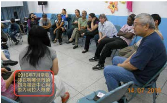
2010年7月常牧師在嗎哪佳市的四海福音中心與委內瑞拉人聚會

創傳又於2010年7月19日在委京正式成立「委京四海社區服務中心」，服務委京的教會、弟兄姊妹及未信主的人，包括華僑及委國人民：服務項目有：1. 惠僑服務：翻譯中西文、開設西文班、中文班、英文班、作業補習班等。2. 婚姻及家庭問題輔導，3. 神學課程訓練，4. 教會領袖訓練。總的來說，這是整全的服事，顧到全人身心靈的需要。新移民對西文班很感興趣，每期都有十多人參加，並且很樂於推介委京四海社區服務中心的事工。