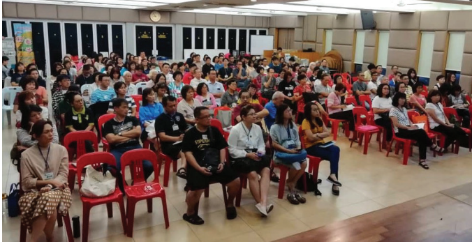
「馬來西亞新山班上課情形」

記得神呼召我加入四海讀經會，其中一節印證經文，是出埃及記3:12神說：「我必與你同在。」自2019年12月至今肆虐全球的新冠狀病毒(Covid-19)疫情中，我再次體會神是與我們同在的。