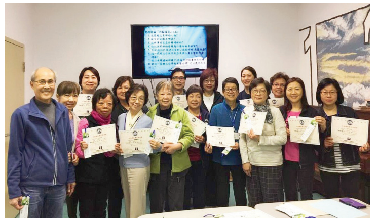
「加拿大北約教會結業式合影留念」

在疫情期間，異端全能神教也積極的在影響基督徒，他們冒充正統基督教宗派之名，在臉書開設群組邀請基督徒參與。我也體會在這種時候信徒更需要主話語的餵養，不然信徒極容易被異端影響。感謝神讓我們整個團隊同心的克服困難，堅持繼續課程，沒有因限制行動管制令就讓我們放棄學習，放棄服事。我們當思念天上的事，為他人的益處與神的榮耀多付出努力。無論風暴有多大，神是平靜風浪的主，只要有主在我們的生命中，祂必定帶領我們到達目的地。我們只管信靠順服祂，因為主是信實的，要與我們同在的應許沒有落空。