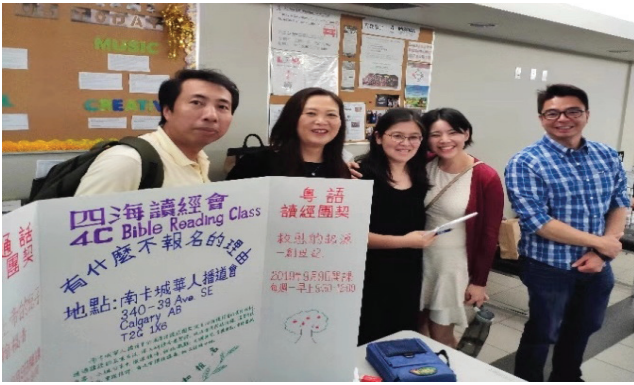
加拿大南卡城班招生和推廣四海讀經會