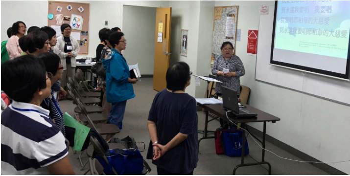
「加拿大多倫多班上課情形」