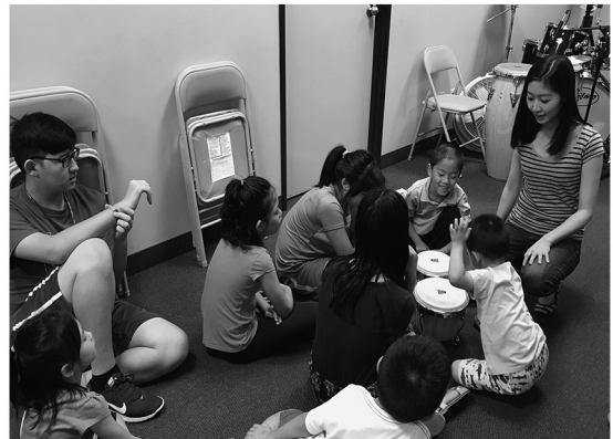
兒童歡樂營的小朋友認識樂器

感謝神，在十二月的時候，我們將會到附近的社區或是商場報佳音。藉由這個機會，傳揚主耶穌的福音，並將他對世人的愛，用音樂詩歌和訊息短講在這鄰舍傳揚出去，好叫世人可以見證主耶穌基督！詳細地點和時間，會在之後公佈，歡迎大家有空可以共相盛舉！