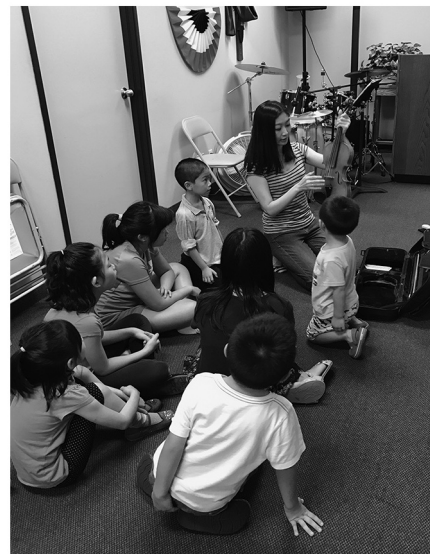
藉由向孩童介紹樂器，啓發他們的興趣