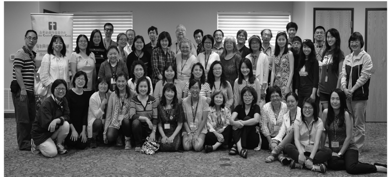
「四海讀經會同工退修會大合照」