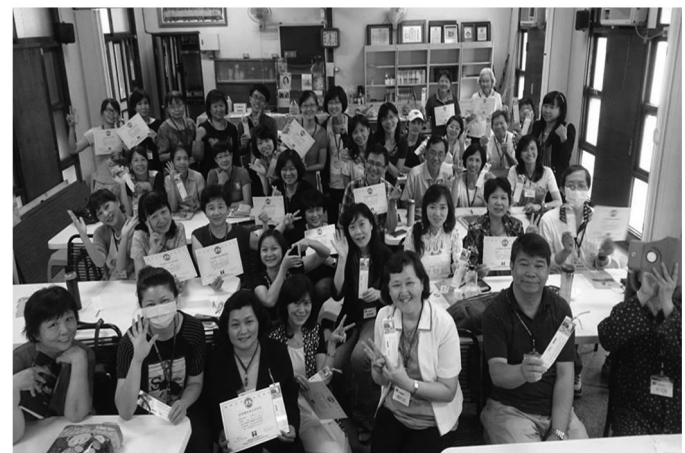
台南班結業合影留念

四海讀經會目前在北美、加拿大、委內瑞拉、台灣和馬來西亞都有班級，亦有網路班可以參加。更多訊息，請上 www.4c-ministries.org/4cbrc/ 或 Email: 4cbrc@gmail.com 和我們聯繫！