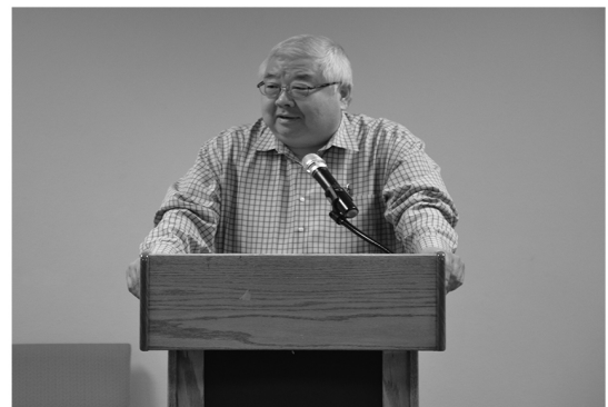
常牧師講授約翰一書