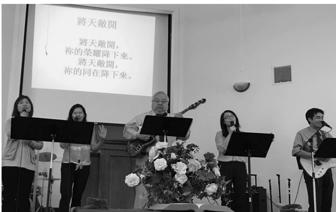
四海團隊帶領敬拜

感謝神，這次的短宣學習到很多，看到團隊的互相配搭，小孩子的順服父母，並且喜悅參與教會的事工，常牧師對團隊各人的關懷和任勞任怨，令我感受到在創傳的事奉，彼此之間的互相關懷、愛護