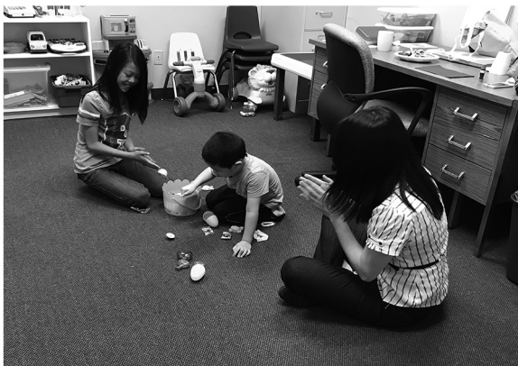
平日兒童主日學時間

看著這幾位小朋友每週的學習和成長，能單純的心接受耶穌基督，不用去顧慮和擔心，從小就能認識主耶穌基督是何等有福氣的事！