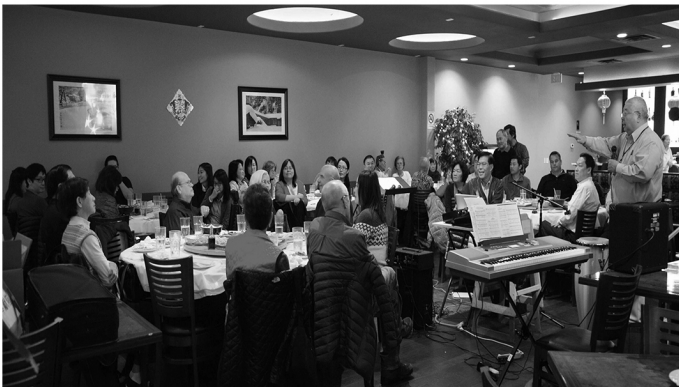
四海之家十週年慶祝聚會

我深信神使用四海之家必有祂的美意，也相信在這新的一年裡，要大大的擴張我們的境界，接觸到更多的福音朋友，藉由生命的接觸、生活的交流來同享生命的美好！