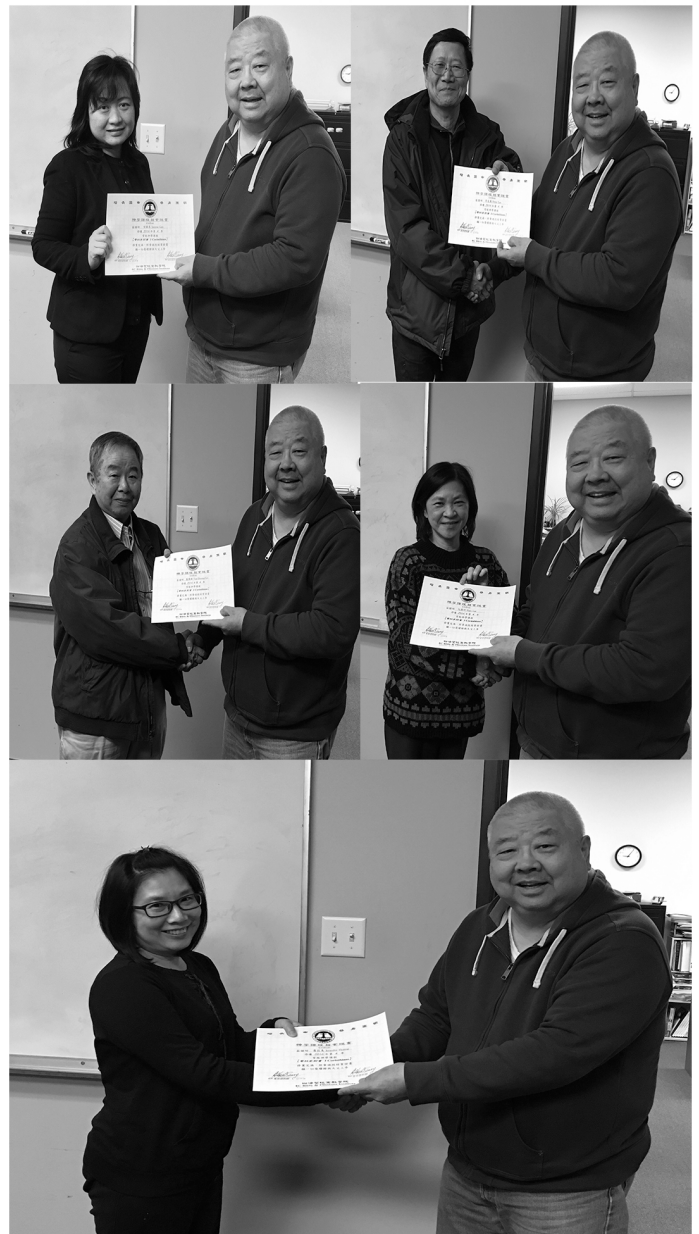
常牧師頒發學員證書