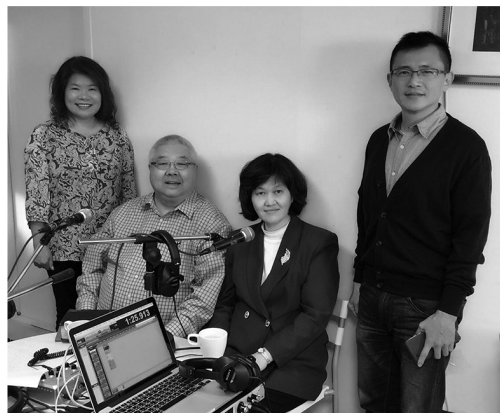
常牧師和師母接受福音電台專訪

VI. 台南有兩個福音電台訪問了我們夫婦，一共錄了三個專輯。在專輯中我們有機會分享到個人得救的見證，如何認識交往，一些事奉的理念和神學的觀點與立場，感覺到台灣的福音事工還是非常深入群眾和頗為普及的。