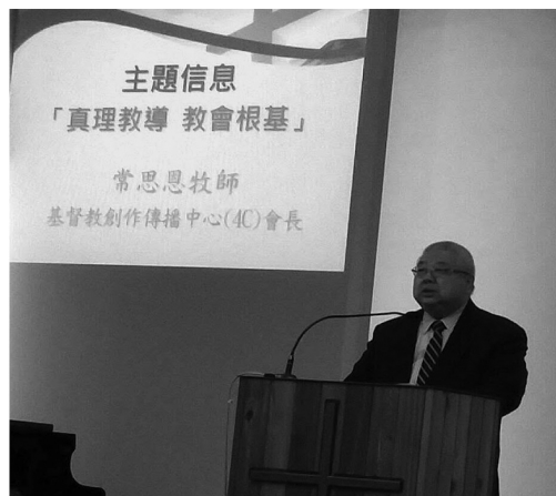
常牧師一月十五日在台南三一堂證道

這次能去台灣實在是神的恩典和保守，因為出發前的一週我還在住院，當時我跟師母說這一次可能只有她一人前往，我可能是去不成了，但神非常信實，醫生在一月二日替我做了一Electrical Cardio version 手術把我的正常心律復回，才能成行。在整個過程中，我經歷到生命的寶貴、家庭親情的濃厚。同時亦讓我看到了台灣教會的一些需要，就是神學和領袖的培訓和栽培。我極期待下一次訪問台灣的機會！