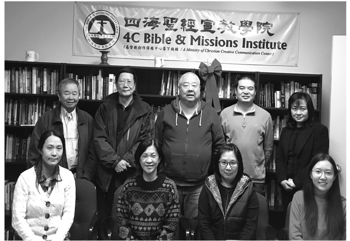
哥林多前書課程結業合照

四海聖經宣教學院二零一七年的年度課程出來囉！為了讓弟兄姊妹提早安排和規劃課程，本年度將四季的課程分別出來，深入地學習經文和應用在生活當中。如果您對宣教學院的課程有興趣，還請和我們聯繫詢問更多的資訊。願神祝福大家！