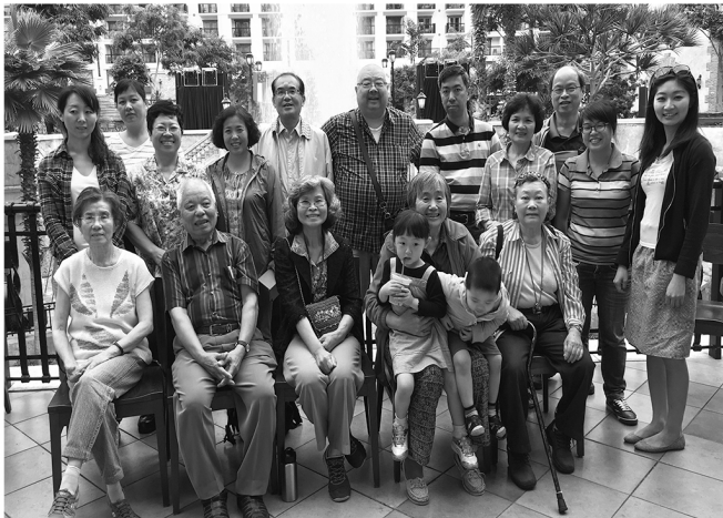
五月二十四日四海之家郊遊，在Gaylord Texan Resort合影留念。