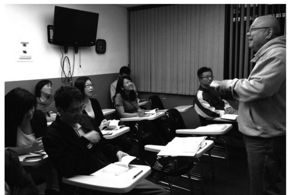
常牧師在委京四海中心培訓

創傳過去十年在委國的事奉是神給我們的恩典。我們願意往前再委身十年，協助當地教會謹守他們福音的責任、堅立教導、訓練門徒、廣傳福音、直到主臨！