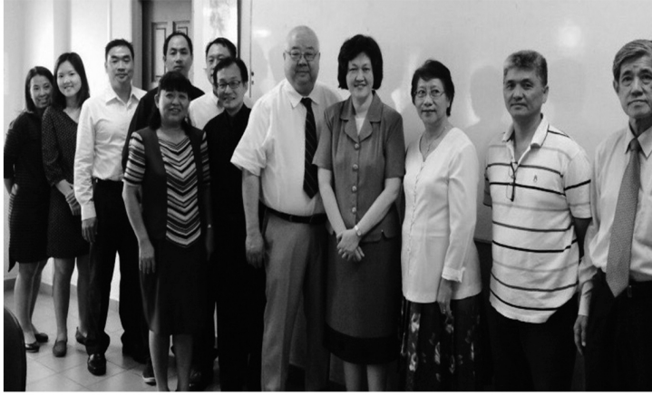
四海讀經會班達馬蘭班老師和同工

2 青少年的孩子也來參加，青少年的那一組也有很美的見證！主任牧師也參與老師教導的職分，他分享剛開始也感到相當吃力，但是要帶頭鼓勵弟兄姊妹學習上帝的話語，就堅持下來。一年下來，他很高興地說現在一週同時準備四海讀經會的課程和準備講道就覺得輕省了。常牧師聽到眾同工的分享感動的流淚。