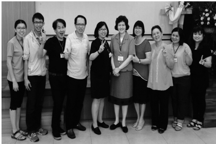
四海讀經會班新山班老師和同工

這次緊接馬來西亞旅程，一週後回到台灣探望北部的老師和同工們，我們一起吃午餐，同工也分享四海讀經會對他們紮實的幫助，他們盼望有更多的教會和神的兒女也能和他們一樣有福氣，生命得建造、有目標。聽到他們的見證，也倍受激勵。在搭飛機回台灣的那天六月二十七日，飛機發生故障，我就遲一天走，就可以在週二清早參加澳洲網路班第一次上課。之後在台南聽澳洲另一新班老師的試講，不簡單！老師本人來自香港要用國語講課實在不容易，花了很多時間備課，結果第一次上課有很好的回應。和澳洲兩班分別不同時同工訓練，田師母也挺身相助，在期間面談一位老師和網路班的一位行政。