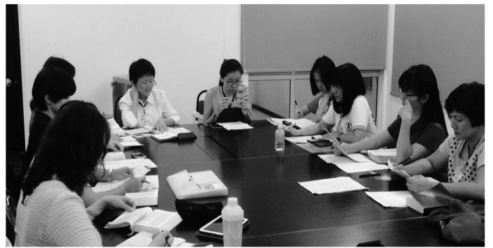
馬來西亞新山異象班今年一月五日新成立，這是五個小組中的其中一組討論。

今年在亞洲地區除了堅固壯大原有的讀經會各班之外，我們期盼可以在台灣、馬來西亞、新加坡再開新班。因應開班的需求，我們需要更多的老師、小組長和行政同工加入，求主為我們預備。也求主讓我們可以接觸更多的教會、讓更多的人知道原來聖經是可以這樣有系統地去讀，讓主的教會和有需要的人可以認識四海讀經會並加入我們。建立社群網絡，讓四海讀經會的觸角到亞洲其他地區。我們請眾肢體成為我們的代禱者為我們禱告；也成為我們的宣傳者在自己的教會以及朋友圈內為我們穿針引線；更成為我們的同工、學員成為那忠心教導別人的人，來完成主的大使命。