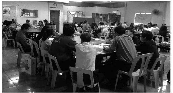
馬來西亞班達馬蘭班小組討論。