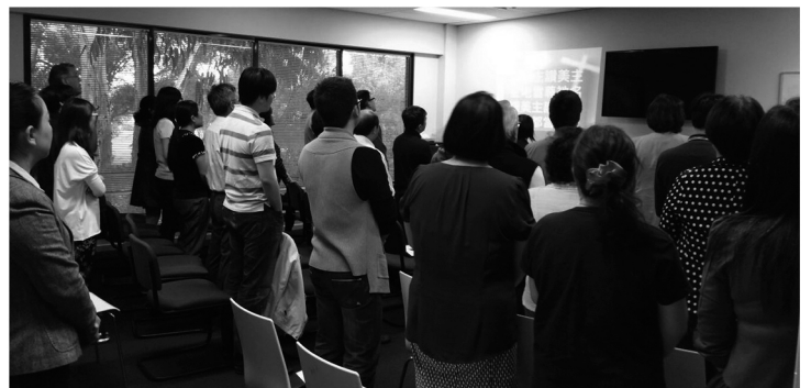
澳洲四海讀經會異象分享之夜。