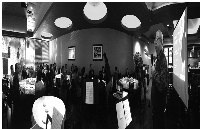
四海之家九週年聚會盛況。