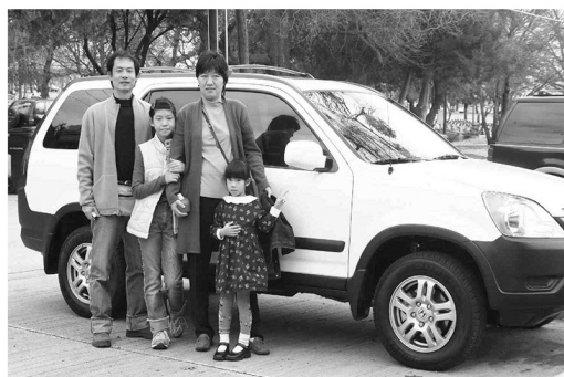
那玉琪姊妹全家福