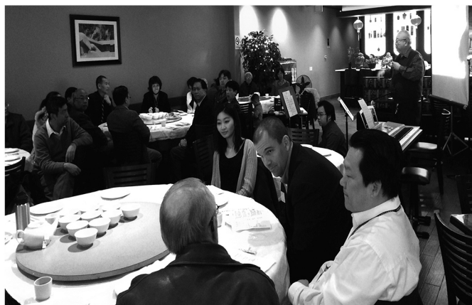
與會賓客彼此交流分享。