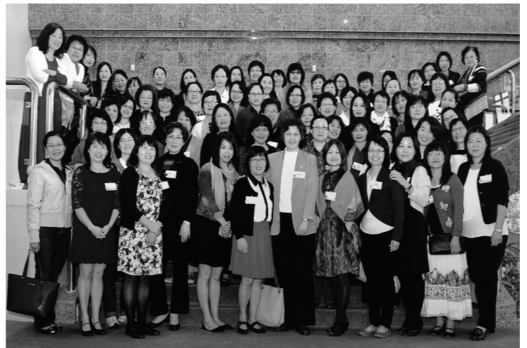
常師母澳洲之旅在師母、神學生一年一次的綠洲小組的早餐會後合照。