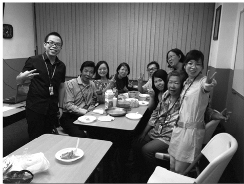
委內瑞拉 讀經會成員

再一次感謝神，讓四海讀經會使我的靈命，信心都增加，願神繼續幫助我在祂的話語中扎根，好好裝備自己，為主去傳福音！（委內瑞拉讀經會）