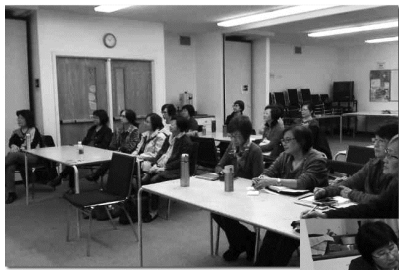
加拿大讀經會上課時間

開課後，我需要用在讀經禱告的時間比從前更多了，這讓我更認識神，也更認識自己。神藉祂自己的話語引領我，教我如何作祂忠心的器皿，我在每一課都有學習和領受，也從師母的材料得到啟發和學習講解經文，之後再將學到的告訴學員。神就是這樣給我機會，藉著讀經班將我從神而來的領受與人分享。所以我是在教導，又是在學習。我學習了，就教導別人，也同時藉教導讓我學習更深。主的安排何等奇妙，感謝主！我現在要做的功課比學員多，學習到的也更多，這樣我就不斷效法主耶穌，叫我走主的路不偏離，而同時又將真理傳承，榮神益人。原來真正的老師是神自己，我是主使用的管道，我只需要盡自己的責任，主來成就祂的美意。看來我小時候要當老師的志願是沒錯的，或許是神一早放在我心裡，給我的心理準備呢！感謝讚美主！願一切榮耀歸與至高的神！（加拿大北約讀經會老師）