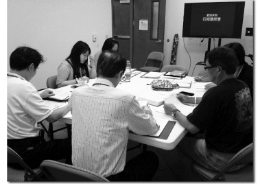
佛州讀經會小組時間

清楚，使我知道自己的軟弱和無力自拔，也正是這種感覺，使我意識到人是無法自救的，只有依靠主才能救我，也更深刻體會到「我的恩典是夠你用的，因為我的能力在人的軟弱上顯得完全」（哥林多後書12:9）這句話的深意。感謝這段時間在四海讀經會的學習，讓我看到了自己的軟弱，也正因為這種無力自救的感覺，將我與主緊緊的連結在一起，使我越來越靠近祂。（佛州珊瑚泉讀經會）