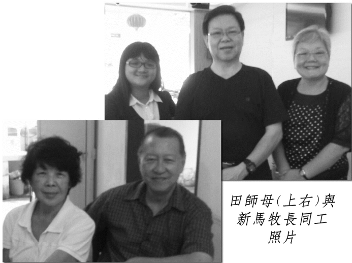
田師母(上右)與 新馬牧長同工 照片

(上接第六頁)對未來我深信，神將成就更美更善的事工在其中。請我們繼續穿上屬靈的全備軍裝，來贏得這場聖戰吧！願一切榮耀歸給神！（作者是台灣四海讀經會同工）