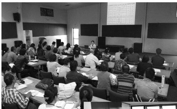
紐西蘭讀經會上課與小組

通過查經我們的信心被一再考問，這也許是神的子民一生所要做的功課。感謝主賜給我們這樣的感動，感謝四海讀經會，願主的話語進到每個人心中，融入每個人生命裡。(紐西蘭讀經會)