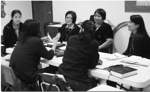
滔沙讀經會上課時間

我這次回台灣是因為媽媽跌倒髖骨骨折，開刀換髖關節，對九十幾歲的老人身體很傷，醫生都預期她可能以後都要臥床。但是我知道這裡面有屬靈的爭戰，因為我媽媽最近搬家，我們拒絕照民間信仰去選日子，或避免在農曆七月搬（有一個哥哥就要選日子）。當媽媽受傷後，我們就禱告，相信我們的神大過一切，絕不會讓仇敵有機會誇勝。我們求神為了祂榮耀的緣故，媽媽不但不會長久臥床，也不僅能坐起來，神還要顯大能讓她起來行走。感謝主，果然在一個月之內她傷口不但恢復的很好，也已經可以起來行走了！（滔沙讀經會老師）