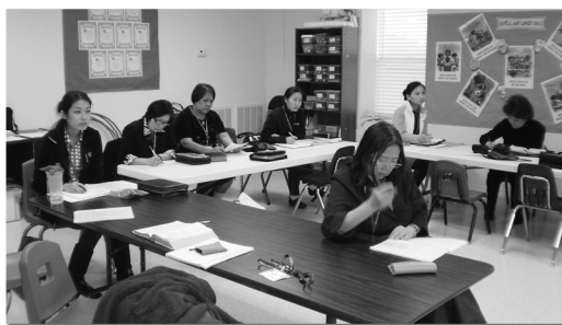
滔沙讀經會上課時間