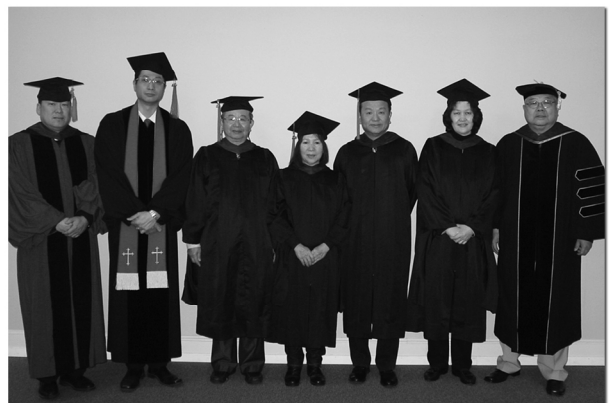
畢業生與院長，老師及董事合影

(編者註：以上是2013年十一月二十三日四海宣教聖經學院畢業典禮時院長常思恩牧師的講詞)